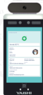
GREEN PASS ok